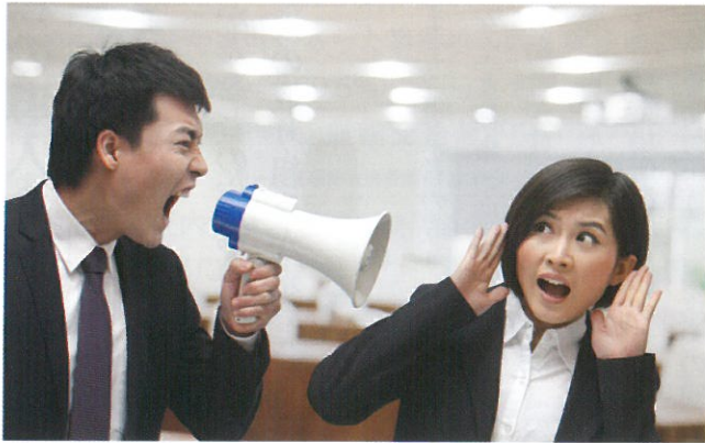
暴言などによる精神的な苦痛もパワーハラスメント